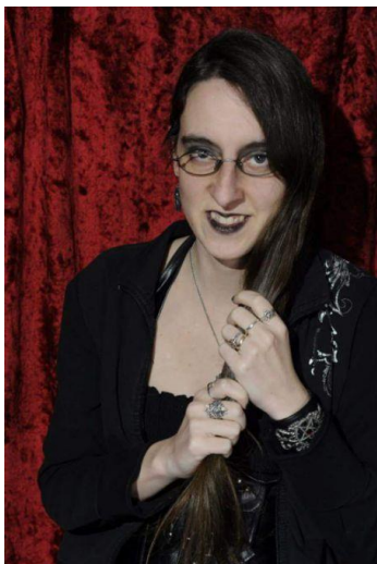
Aisis Kiosque #40