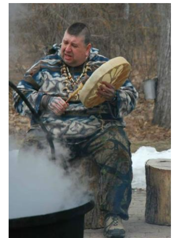
Ki-On kiosque #49