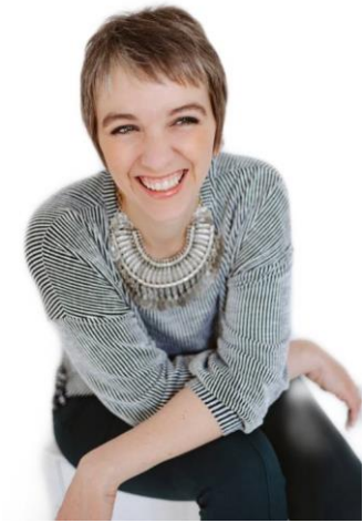
Louna Kiosque #11