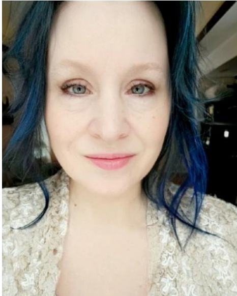
Abie Pas de kiosque

Après le salon Samedi 17h à 18h dans la Chapelle