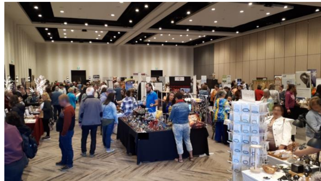
Photo salon 2023 première édition avec 750 visiteurs

J'en ai vu à moins de 100$ la nuit pour 2 lits